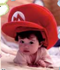
R7. 4. 10生まれ 深日 井上 巳愛ちゃん