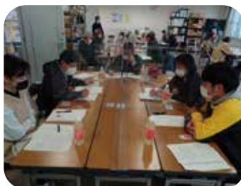
クロスロードの様子

11月13日に開催した災害ボランティア養成講座（レベルアップ編）では、災害ボランティアのスキルアップと災害ボランティアリーダーの育成を目的に、地域防災図上演習の一環である災害対応カードゲーム「クロスロード」を行いました。「クロスロード」を通して災害ボランティアリーダーとしての意識や決断力の向上、コミュニケーションの大切さと常日頃からの地域福祉活動やつながりづくりの重要性を学びました。