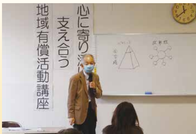
心に寄り添い支え合う地域有償活動講座