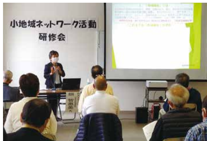
小地域ネットワーク活動研修会