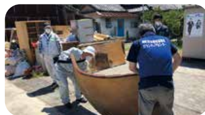
災害ボランティア活動の様子

活動日 岬町内外で災害が発生した際、被災地より要望・要請があれば岬町ボランティア住民活動支援センターより、活動いただけるか確認のご連絡をいたします。