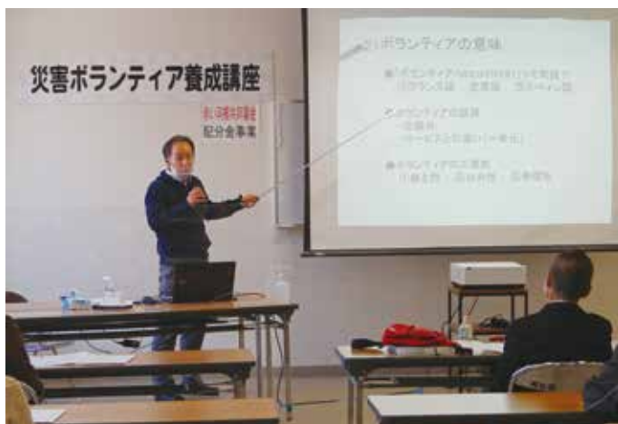
災害ボランティア養成講座 (詳細は7ページをご覧ください)