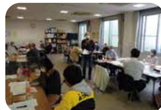
参加者による発表の様子