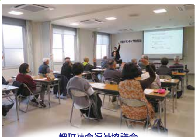
岬町社会福祉協議会 「災害ボランティア養成講座」