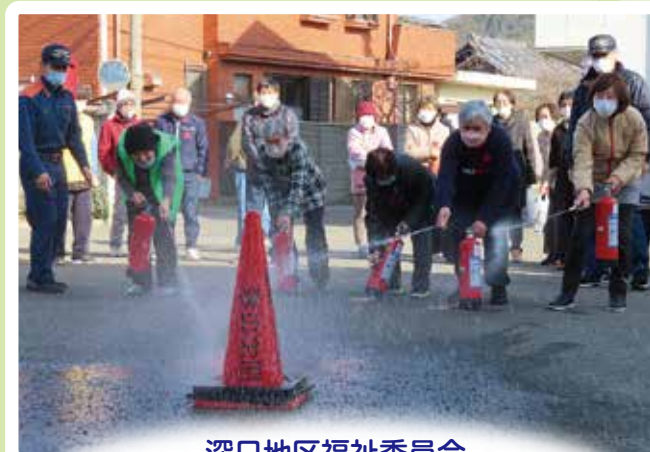
深日地区福祉委員会 「防火・防災体験研修会」