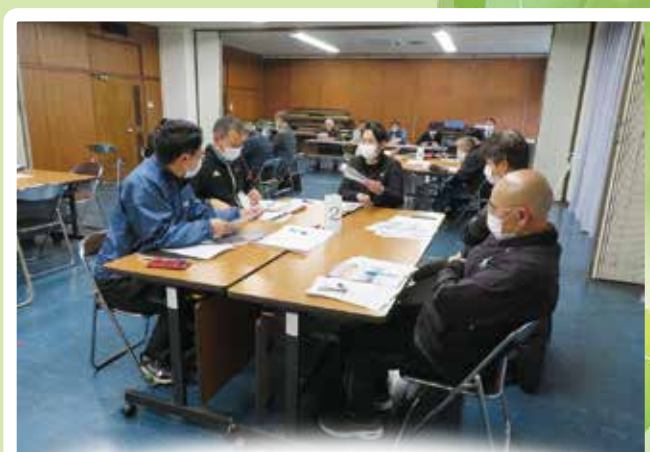
岬町まち歩き声かけ訓練実行委員会 発足 予告 令和6年5月17日訓練実施