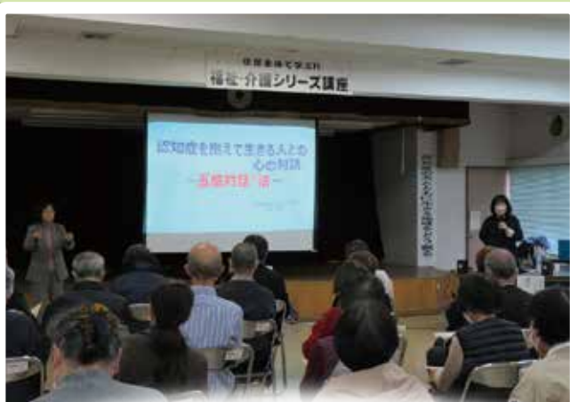
住民主体で学ぶ！！ 福祉・介護シリーズ講座 「認知症の方とともに生きる地域をどう創る」